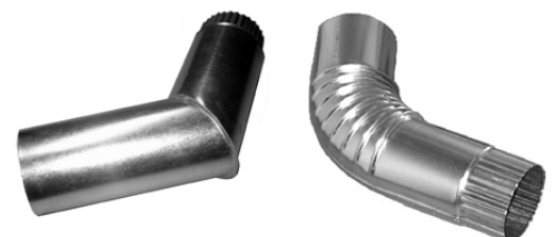
Perinnekouruun voit valita aitoa käsityötä olevat saumamutkat tai "nuorekkaammat" ns. haitarimutkat...