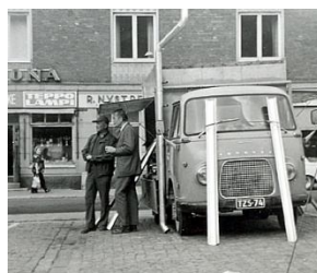
Ennen kourut ostettiin torilta, nykyään netistä www.kattotarvike.com :sta