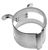
Syöksytorveen saatavilla myös todella vanhan ajan printtikiinnikkeet