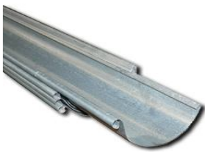
Perinnekourut toimitetaan 4 ja 6 metrin mittaisina

Monet Perinnekourun innovaatiot ovat kantaneet yli vuosikymmenien. Asennusta helpottamaan ja käyttöikää pidentämään on toki vuosien varrella tehty monia pikku parannuksia, mutta tärkein - ajaton perinnekourun ulkonäkö - on aina säilytetty. Valitsemalla Raineri Perinnekourun valitset Suomen perinteikkäimmän sadevesijärjestelmän, laadusta ja asentamisen helppoudesta tinkimättä.