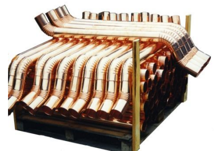
Perinnekourua saa myös kuparisena. Kysy lisää!