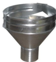
Keräilykartiot liittävät syöksytorvet klassisen konesaumakaton jalkaränneihin